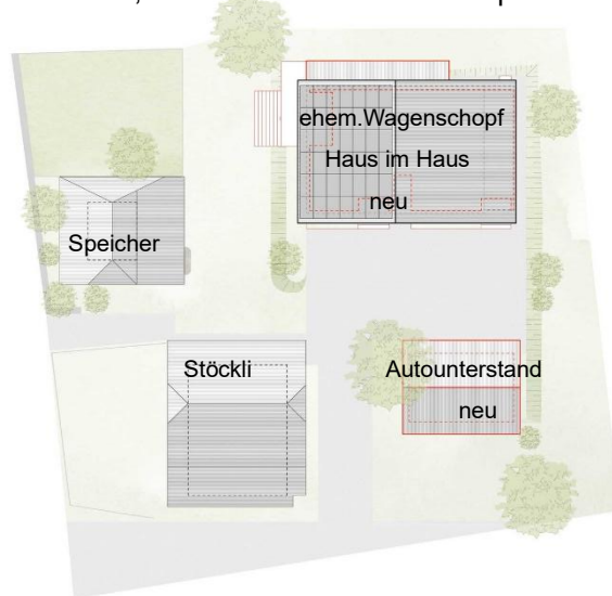
Plan: Atelier Marcel Hegg GmbH

Durch die Setzung des neuen Autounterstands entsteht mit dem Schopf, dem bestehenden historischen Stöckli sowie dem Speicher eine Hofsituation, welche zum neuen Zentrum der Gebäudegruppe wird. Zudem wird durch die neue Loggia mit Veranda im Süden des Schopfes ein zweiter gefasster Aussenraum aktiviert, was eine hohe Aufenthaltsqualität schafft.