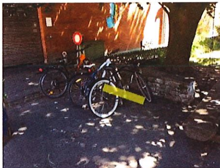
9 Jugendarbeit Hauptstrasse bei der Mauer