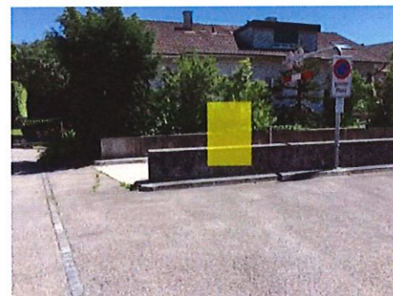
12 Werkhof Friedhofweg bei Einfahrt Tiefgarage