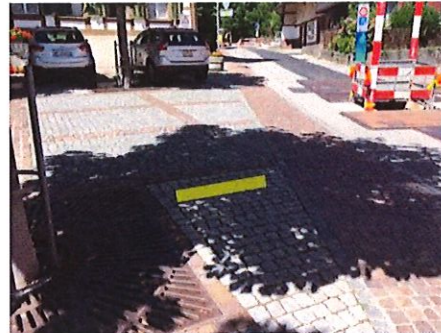
6 Gemeindehaus Mettgasse