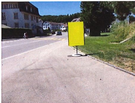
7 Elektrizitätsversorgung im Fussgängerbereich