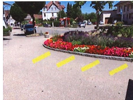
8 Post Bahnhofstrasse neben Blumenrabatte