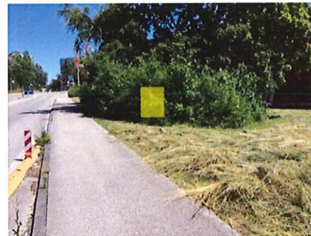
10 Mehrzweckanlage Erlenstrasse